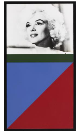
M.M. Blue & Red, 1990